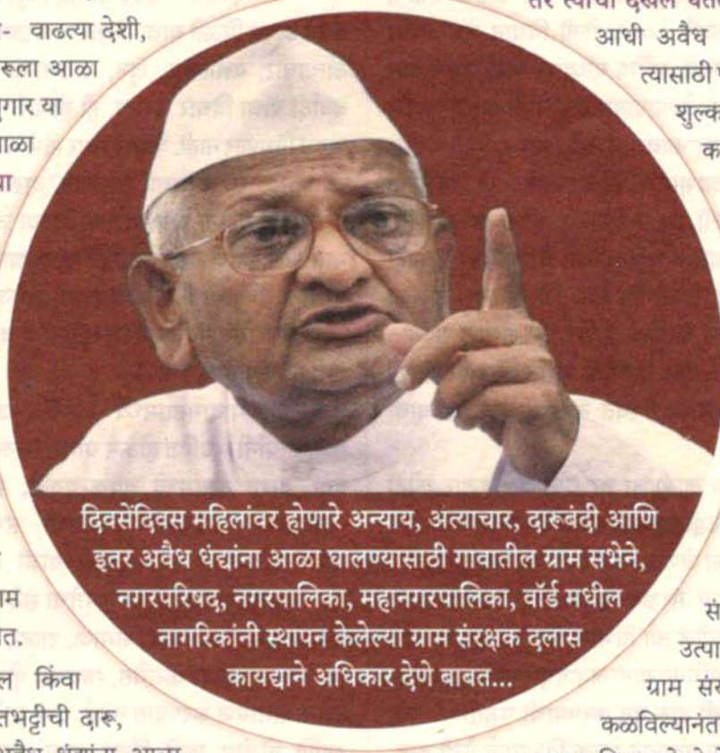
दिवसेंदिवस महिलांवर होणारे अन्याय, अत्याचार, दारूबंदी आणि इतर अवैध धंद्यांना आळा घालण्यासाठी गावातील ग्राम सभेने, नगरपरिषद, नगरपालिका, महानगरपालिका, वॉर्ड मधील नागरिकांनी स्थापन केलेल्या ग्राम संरक्षक दलाला कायद्याने अधिकार देणे बाबत...

अशा प्रकारे अवैध धंदे करणाऱ्या व्यक्तींवर तीन वेळा गुन्हे दाखल झाले तर त्या व्यक्तीला एक किंवा दोन वर्षे जिल्हा तडीपारची सजा करण्याची तरतूद या कायद्यात असावी. त्याचप्रमाणे महिलांवरील अन्याय, अत्याचार, बलात्कार यांसारख्या गुन्ह्याचे स्वरूप गंभीर असेल तर अशा गुन्हेगाराला तीन वर्षे ते दहा वर्षे कठोर कारावासाची शिक्षा असावी. अशा प्रकारची कठोर तरतूद कायद्यामध्ये झाली तरच महिलांवरील अन्याय, अत्याचार व अवैध धंदे याला आळा बसू शकेल. त्याचप्रमाणे दिवसेंदिवस देशी, विदेशी, हातभट्टीची दारू पिऊन गावात गोंधळ घालणे, भांडणे, मारामाऱ्या करणे असे प्रकार ही वाढत चालले आहेत त्यामुळे खेड्या-पाड्यातील शांततेचा भंग होऊन कायदा आणि सुव्यवस्थेला धोका