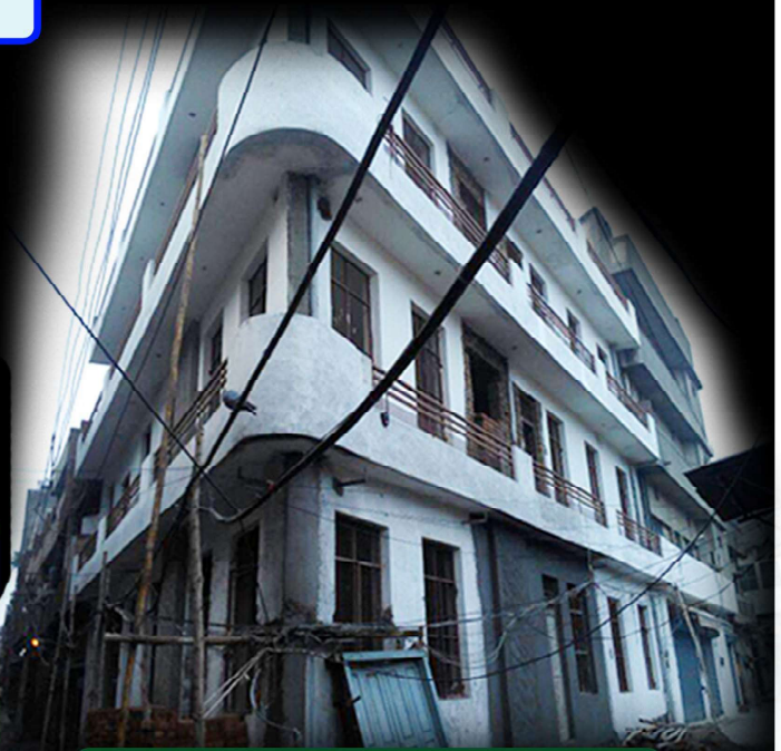
शिकायत-पत्र भेजने के बाद की तस्वीर